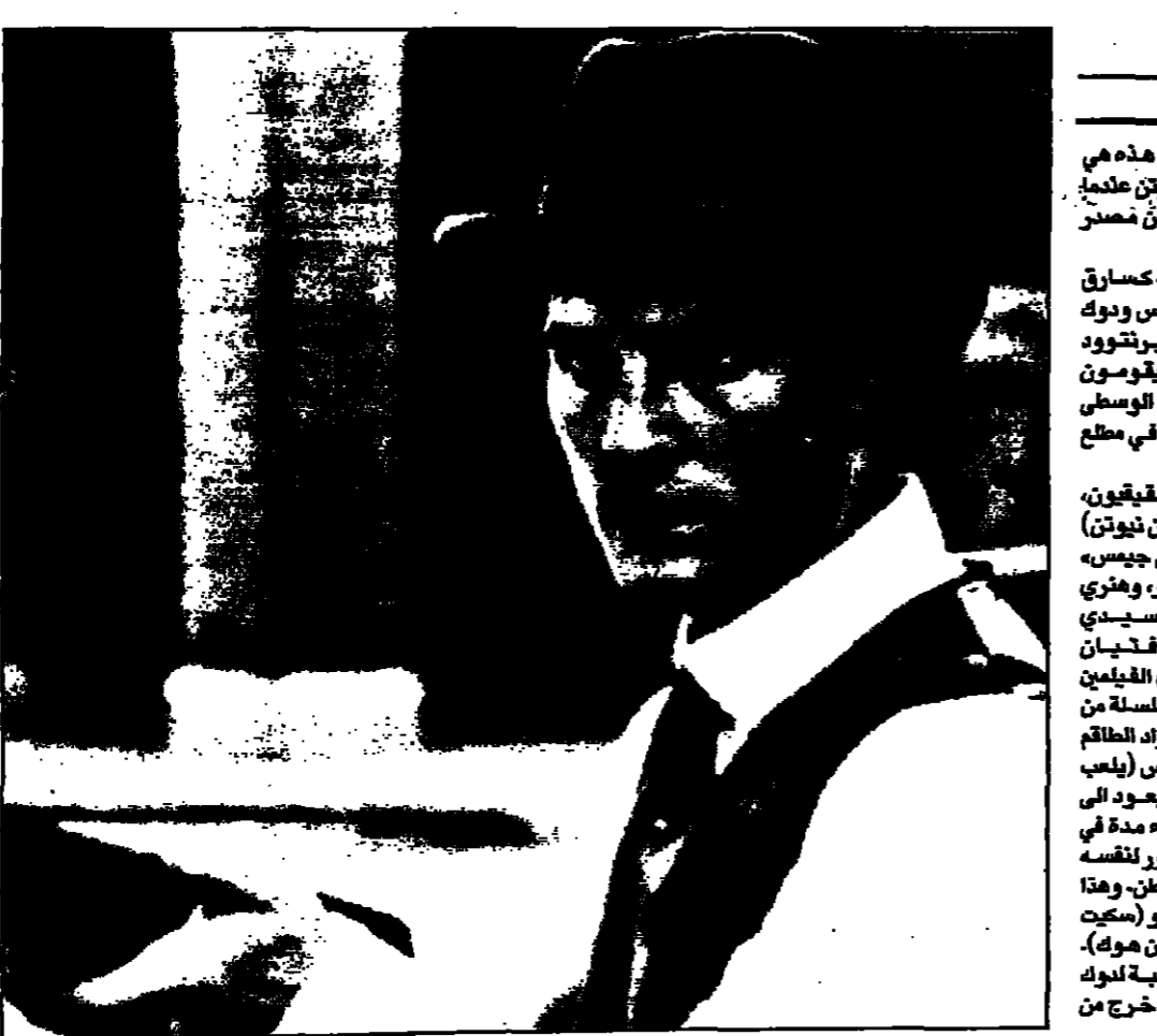
ماثيو ماكورومي في دور ديانا نيوتن في فيلم قتيان نيوتن